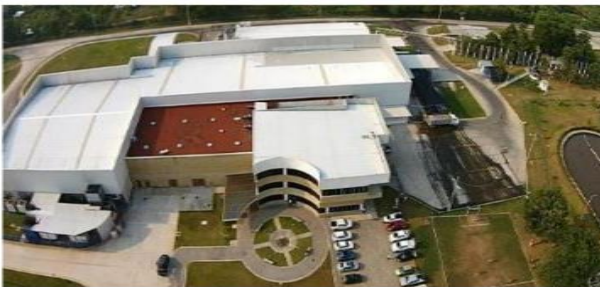
Amacoite, Ostuacán, Chiapas